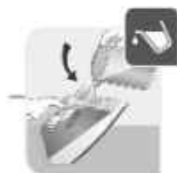
ورودی مخزن آب