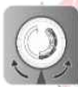
درجه تنظیم دما